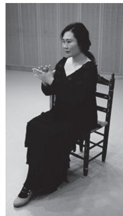
パルマを叩くときの姿勢

スペインでは、11、12拍目はカウントしないか、1、2(ウン、ドー)とカウントします。決して12からカウントしないように注意してください。ソレアのパルマのたたき方は来月号で詳しく説明します。アクセントのある拍にしっかり足をふむ練習をしておいてください。